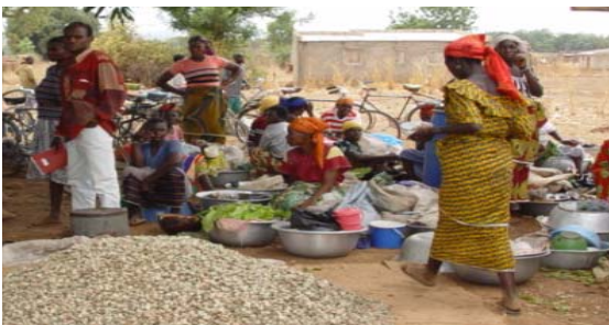
Place du Marché, l'ouest du Kenya

L'hôte du premier Forum Africain du PDDAA est le Ministère de l'Agriculture du Kenya. Le Forum est organisé par le NEPAD (le Nouveau Partenariat pour le Développement en Afrique www.nepad.org ) qui a été établi en 2001 suite à l'engagement des leaders africains d'éradiquer la pauvreté et de positionner leurs pays sur la voie du développement durable. Comme décrit dans son Programme Détaillé de Développement de l'Agriculture Africaine ( www.nepad-caadp.net ), l'agriculture et la sécurité alimentaire constituent un secteur d'une priorité importante pour le NEPAD. Le PDDAA vise à augmenter la quantité et la qualité de la nourriture produite en Afrique pour renforcer davantage la sécurité alimentaire des populations et la rentabilité des exportations.