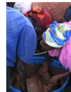
Expériences agricoles réussies à partir du bas: la production artisanale de beurre de karité par les femmes au Burkina Faso